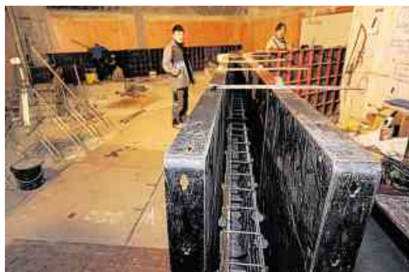
Eine Schicht fehlt noch: Zwischen den schwarzen Stahlträgern wird 20 Zentimeter dicker Beton gegossen. Der Tanzraum schwebt im Gebäude über dem Boden.