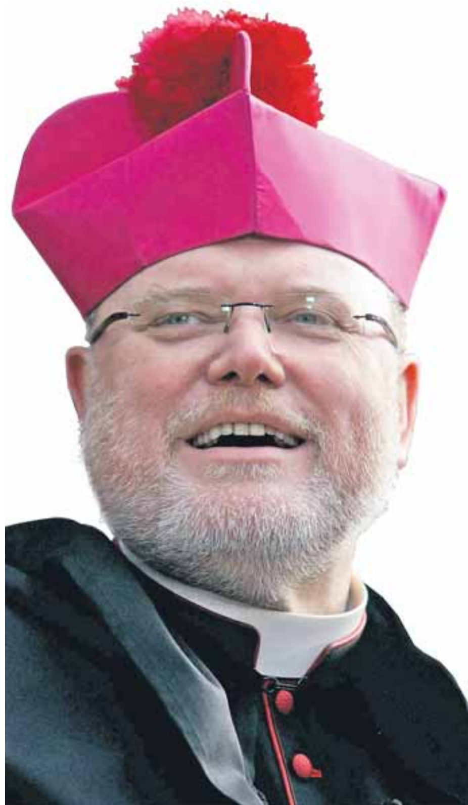
„Gott ist das absolute Geheimnis“, sagt Erzbischof Reinhard Marx.

Marx: Kondome sind ein kleineres Übel und deswegen soll man es bitte auch so nennen. Wichtiger ist die partnerschaftliche Treue. Wenn jemand aber mit wechselnden Partnern Sex haben will, erst recht wenn er weiß, dass er Aids hat,